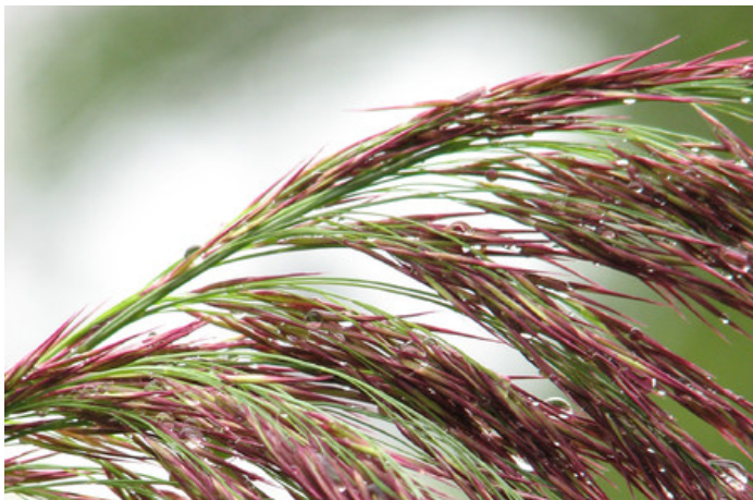
Inflorescence d'une graminée photographiée après une averse, Sorel.

Le titre de l'œuvre , le lieu. Le détenteur (normalement le nom de l'artiste) des droits précédé du signe ©, la date